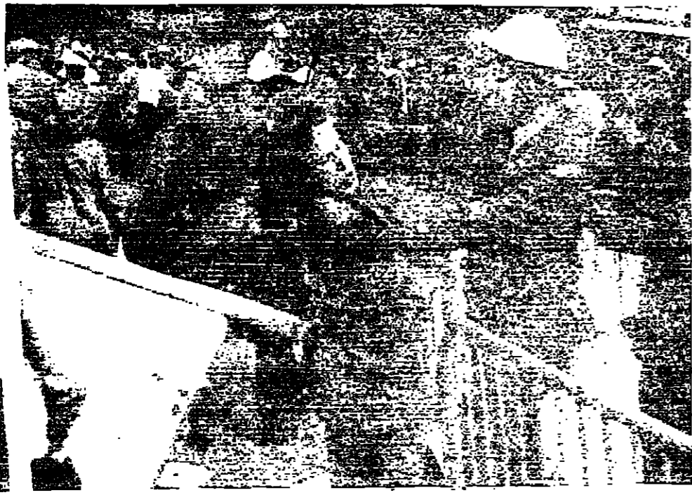
شرطة فرانكفورت خلال استقبالها المظاهرة أمس خارج كنيسة سانت بول حيث منح الرئيس السوفياتي ليونيد ستنور جائزة السلام لشكري الكعب في المظاهرة الغربية. ومما يكثر ان المظاهرة اعترضوا طريق سفير اسرائيل واحاطوه ووضوه بانته خنزير